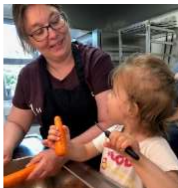
Kontakt og mestring

Et eksempel fra hverdagen på hvordan læring finder sted over hele dagen.