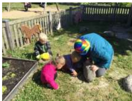
Nysgerrighed og fællesskab